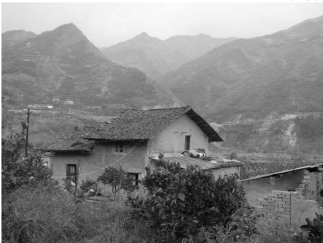
Maisons traditionnelles en pisé (Préfecture de Kaixian) dans un paysage montagneux typique de la région